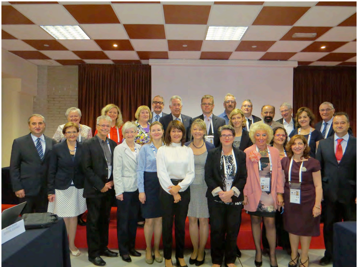
Les membres du Comité Directeur réunis pour leur réunion semestrielle à Cervia